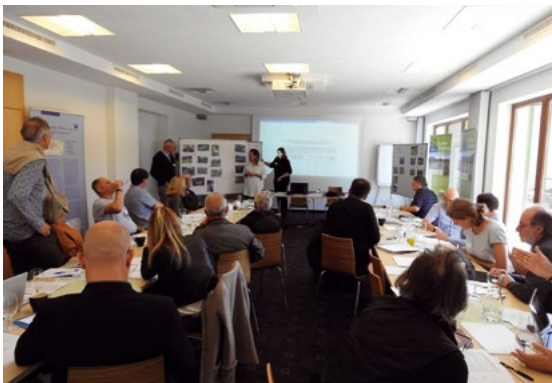
Groupe de travail pour la candidature UNESCO, Zams, 2021