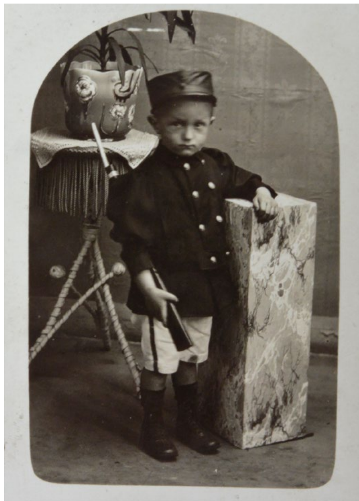
Collection Benoît Goffin