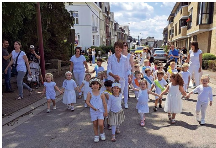
Les tout-petits participent à la Saint-Jean avec leurs institutrices.

L'organisation de la Saint-Jean a été reprise par les trois écoles de la ville, ce qui veut dire que, comme la fête se pratique durant l'après-midi d'un jour scolaire, les élèves sont obligés d'y participer, vêtus de blanc. La transmission scolaire est par conséquent la principale source de médiation pour cette tradition. Elle peut différer cependant pour chaque école : certaines y font tresser les couronnes de marguerites, d'autres expliquent l'histoire de la Saint-Jean mais toutes apprennent aux enfants le chant traditionnel de la Ronde do l'Sint-Tch'han .