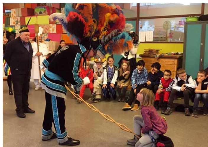
Les personnages masqués du Cwarmé , comme la Haguète , se présentent aux enfants de l'École des Grands Prés.

Tous les établissements scolaires consacrent surtout un temps considérable à l'enseignement de la tradition du Cwarmé , à l'aide de bon nombre d'activités, et nous remarquons aussi un grand dévouement dans chaque école de la part des enseignants pour transmettre cette tradition. D'abord, toutes les écoles, tant maternelles que primaires, participent au cortège du premier Jeudi gras : les costumes sont réalisés en classe et le jeudi après-midi est consacré à l'habillage et au maquillage, avant d'aller défiler dans les rues. Il est important de noter