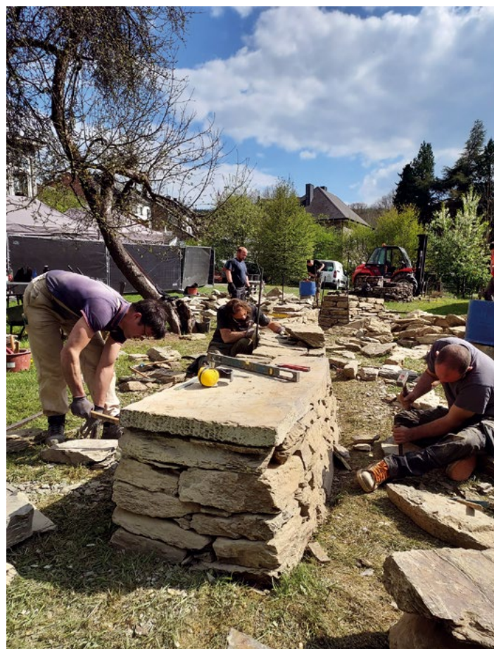
Formation professionnalisante permettant aux stagiaires de tester la construction d'un mur en pierre sèche artistique dans le jardin du Parc naturel des deux Ourthes à Houffalize

En Belgique, reconnue comme Petit Patrimoine Populaire Wallon depuis 2010, la restauration de