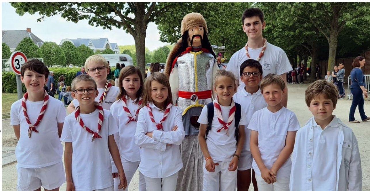
Collection Rénovation du Cortège