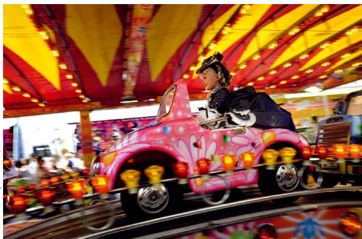
Cliché réalisé à l'occasion de la mission photographie commandée par la FEMS : La Reine à la fête foraine , Charlieu, septembre 2011