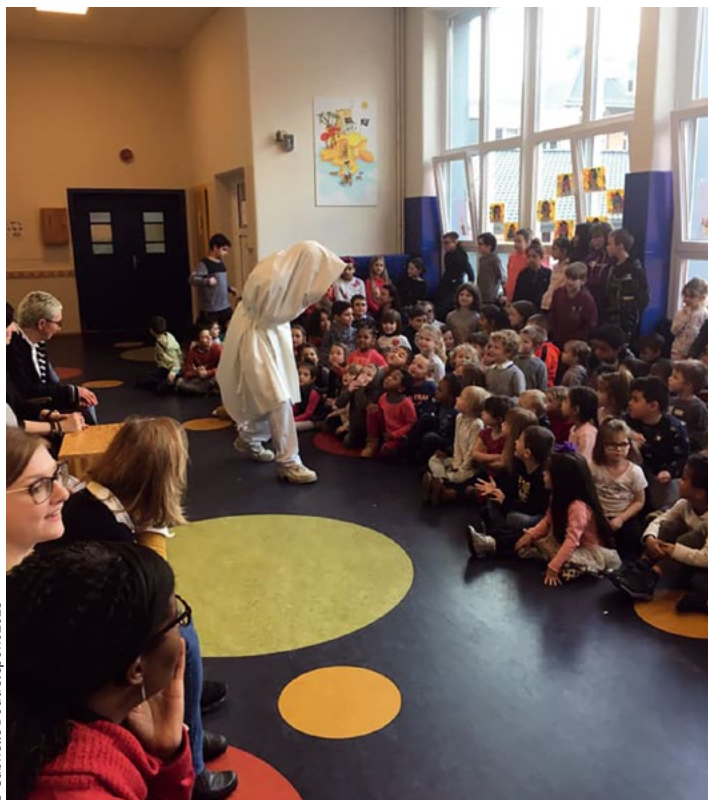
Ici, la Djousène se présente aux enfants de l'École fondamentale du centre personnages.

que, le cortège se déroulant le soir, les élèves ne sont pas obligés d'y participer. Rares sont cependant les enfants absents. Ils ne sont pas punis, bien sûr, et, comme ils ont confectionné leur propre costume, ils peuvent le garder, par exemple pour participer au bal masqué organisé par l'école.