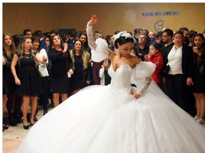
Mariage gitane, Bellegarde, 2016. ©Kristel Amella, C613 - Coll. Museon Arlaten-musée de Provence

Les mariages, appelés Késémen dans la communauté gitane, sont des temps forts de la vie du groupe. Ils constituent une obligation implicite dont l'objectif majeur est d'assurer la reproduction sociale, une descendance. Souvent réalisé entre 17 et 23 ans, le mariage unit un homme à une femme de la communauté et permet de contrôler la sexualité et le désir chez les jeunes générations.