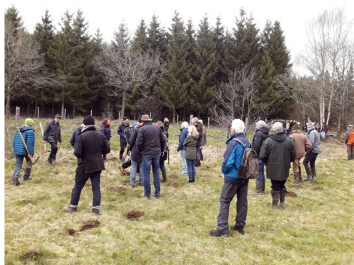
Visite du canal d'abissage de Cierreux lors du colloque 2023

Ainsi, depuis 2015, le « Beirat » – dénomination usuelle du Conseil consultatif ; ses membres étant majoritairement germanophones, la langue privilégiée est l'allemand – se réunit chaque année dans l'un de ses pays membres. Ces réunions permettent de faire un point sur les avancées et projets au niveau régional mais sont également l'occasion de réaliser des visites sur le terrain. Les membres y évoquent les difficultés qu'ils rencontrent et recherchent des solutions ; les bilans régionaux ainsi que les visites affinent la connaissance de la pratique dans les pays voisins et favorisent les échanges de bonnes pratiques ; les opportunités de recherches donnent lieu à des coopérations internationales ; les activités transnationales sont valorisées et relayées. De plus, la veille sur les pays