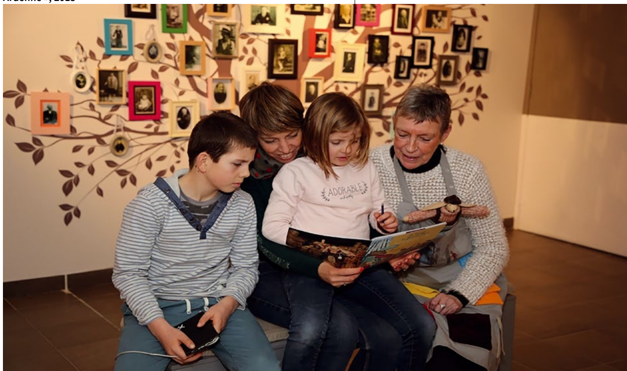
Exposition permanente « Les âges de la vie – naître, vivre et mourir en Ardenne », 2015

Plus récemment, grâce à des fonds européens (LEADER 2014-2020), le musée réalisait le projet « On vivait ainsi ? », véritable travail de mémoire basé sur la collecte audiovisuelle de récits de vie autour de la naissance, de la scolarité, des rapports humains, de l'apprentissage d'un métier, des traditions, des rites, de la vie associative ou encore des événements ayant marqué l'Ardenne, tels que l'Offensive des Ardennes (1944-1945), la catastrophe de Martelange (1967) ou la tornade à Léglise (1982). Le financement permettait la réalisation d'un film de 52 minutes et l'animation de séances de projection à