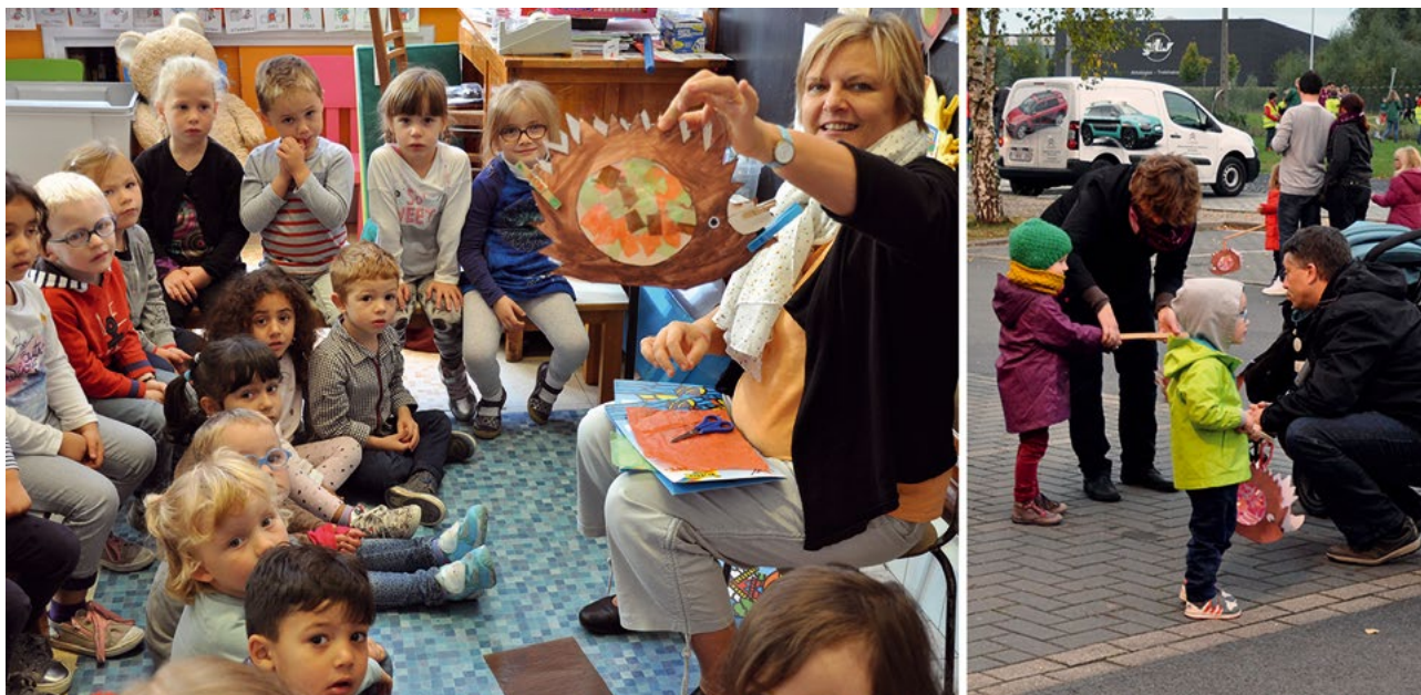
L'allumoir « hérisson » sera confectionnée à la rentrée des classes 2016 par tous les enfants de la classe de 2 e maternelle de l'école Saint-Charles de Luignne et utilisée lors du cortège de la ducasse Nell le 14 octobre 2016.

La soirée choisie pour déambuler en rue varie selon la ville et l'époque, souvent en fonction des modifications apportées aux calendriers scolaires. À Roubaix, c'était à l'origine le premier lundi du mois d'octobre, soit juste après la rentrée des classes fixée au 1 er octobre, à Tourcoing plutôt le dernier lundi de septembre. À Mouscron, on organisait les allumoirs le deuxième lundi de septembre. Aujourd'hui, les festivités se tiennent de la fin septembre à la mi-octobre, les vendredi et samedi soirs étant préférés au traditionnel lundi car ils autorisent une grasse matinée aux enfants.