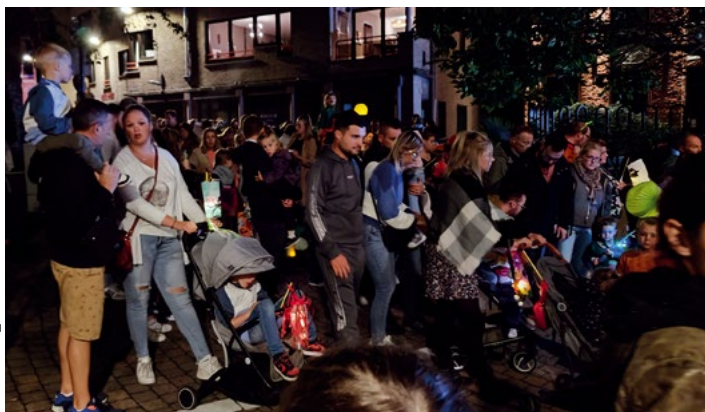
Cortège des allumeurs photographié le vendredi 29 septembre 2023, sur la Grand-Place de Mouscron