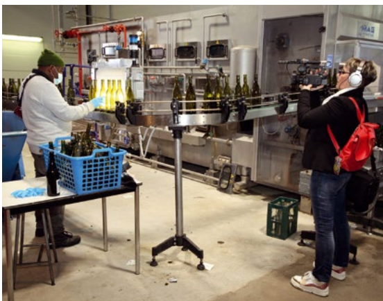
Enquête menée par le Musée de la Vie wallonne sur la transition écologique