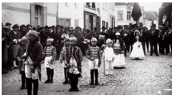
Le cortège miniature du Corso Fleuri de 1936

Si on prend le cas de la Ducasse d'Ath, il est assez clair que les traditions familiales jouent un rôle prépondérant. Elles facilitent l'apprentissage des usages et des pratiques. Les plus jeunes sont intégrés dans les groupes qui assurent l'animation des géants en tant que porteurs de tirelire ; ils suivent les géants et ramassent la monnaie offerte par le public enthousiaste. À l'adolescence, le jeune est amené à faire ses premières expériences avec le géant. Il se glisse sous le panier et tente de le soulever. Si sa taille est suffisante et s'il possède assez de force, il effectue ses premiers pas avec le personnage. Il abandonne le rôle de porteur de tirelire pour « faire les pauses », à savoir avancer le géant entre les danses. Au fil des années, le jeune porteur améliore sa technique et commence à réaliser les premières danses. S'il fait ses preuves, on peut envisager la succession avec son père, son oncle ou son beau-père ; quand le plus ancien quitte le groupe, il cède officiellement sa place au plus jeune.