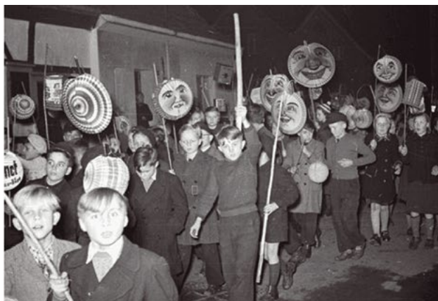
À gauche, un cortège des allumoirs à Mouscron. À droite, un cortège de fête de Saint-Martin à Düsseldorf. Les enfants déambulent avec les mêmes lampions de papier.

Les cortèges nocturnes d'enfants tenant en main des lanternes éclairées, scandant des ritournelles et quêtant des friandises, rappellent d'autres traditions : les fêtes de Saint-Martin (Flandre, France, Pays-Bas, Luxembourg, Allemagne, Hongrie...), les fêtes des encensoirs, le 15 août, à Liège et à Verviers autrefois 11 et les « Guénel » à Boulogne 12 . Si les lampions de papier et les betteraves creusées, où scintille la flammèche d'une bougie, sont similaires à notre fête des allumoirs, le caractère religieux a par contre totalement disparu au XIX e siècle dans la région lilloise. Est-ce une évolution liée aux principes de laïcité hérités de la Révolution française ou de socialisme prôné par les partis ouvriers se développant dans cette grande agglomération industrielle ? Une étude plus approfondie aux Archives de France mériterait d'être menée afin de vérifier cette hypothèse.