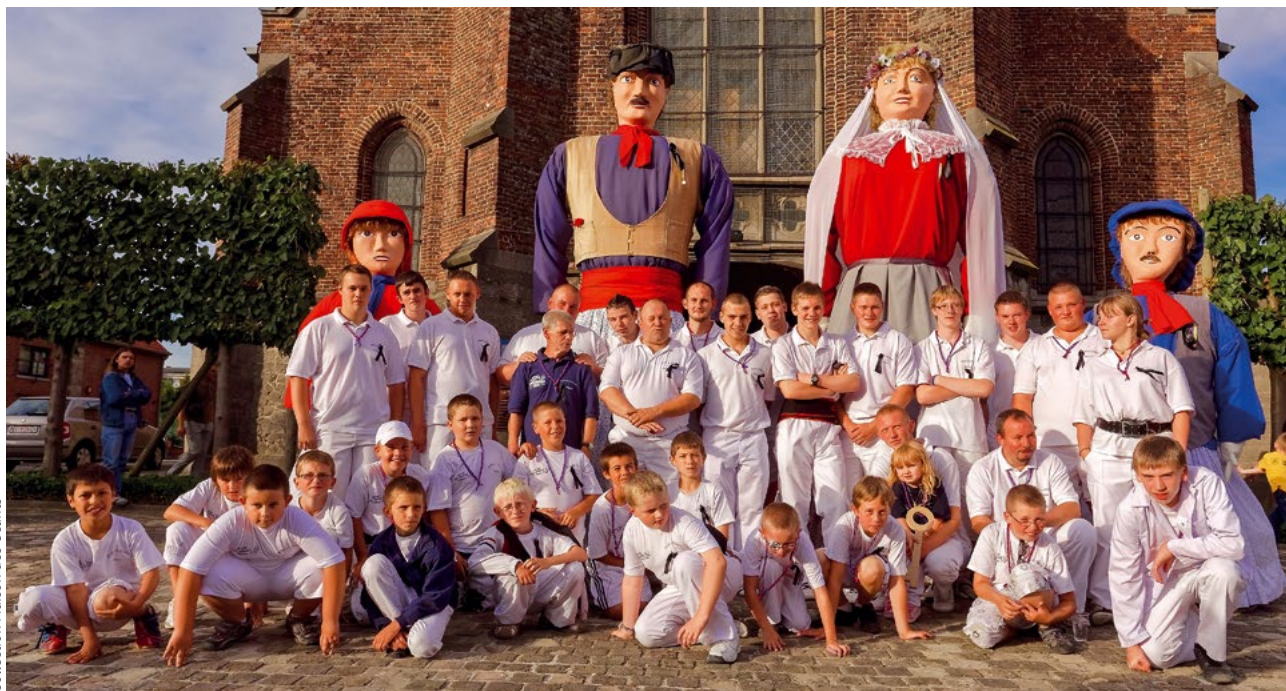
Collection Maison des Géants