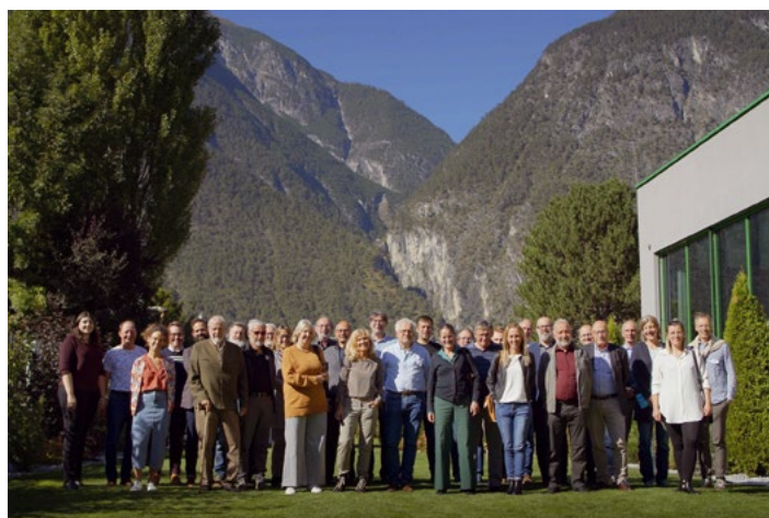
Une partie du groupe européen, Zams, 2021

Mais, avec le développement de l'agriculture moderne au XX e siècle, les agriculteurs ont peu à peu délaissé cette pratique traditionnelle au profit de l'utilisation de machines et d'engrais chimiques leur permettant d'obtenir un rendement des sols plus important. Si bien