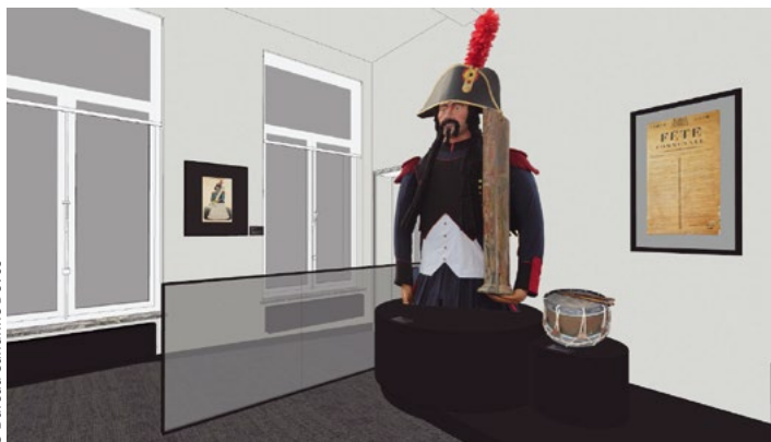
La salle Samson sera consacrée aux confréries et plus largement au monde associatif.

drapeaux, affiches anciennes...), des archives anciennes concernant le cortège (acquit de 1481, ordonnancement de la procession au XVIII e siècle).