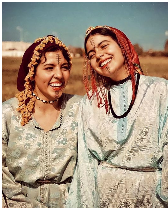
Jeunes filles Amazighes

Premièrement, le dialecte rifain est de moins en moins pratiqué puisqu'une grande partie des Rifains ont immigré en Europe, suite à leur situation difficile au Maroc, et que leur descendance a très vite appris à parler la langue de leur région d'accueil, le français ou le néerlandais par exemple. Souvent, dans les familles, les parents de la seconde génération décident d'apprendre aux enfants le français ou l'arabe, pensant que le rifain n'est plus utile dans un monde où parler l'anglais suffit.