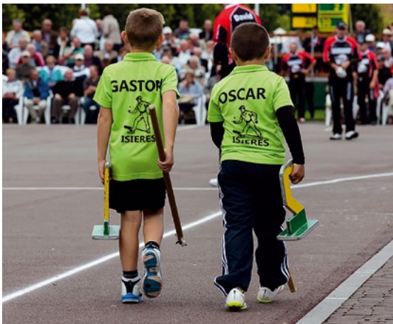
De jeunes marqueurs de chasses

à Tournai au XX e siècle. Cet élan novateur trouvera son aboutissement dans l'ouverture du Musée de la Tapisserie et des Arts Textiles (TAMAT). Aujourd'hui, la tapisserie de lice, forte de ses traditions, se permet d'innover, de se réinventer en toute liberté.