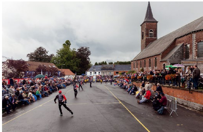
Le tournoi de Sirault, rendez-vous incontournable de la saison

De la fin du XIX e siècle à la veille de la Seconde Guerre mondiale, elle est le jeu de balle n°1 à Bruxelles et en Wallonie. Benoît Goffin, qui lui a consacré deux ouvrages, considère ce jeu comme « un des derniers traits de la société traditionnelle qui a muté avec l'apparition de la télévision et de la voiture, devenue de plus en plus envahissante. »