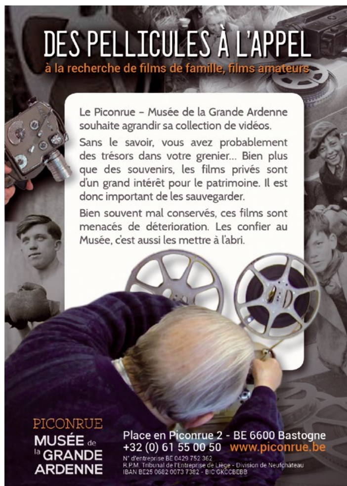
Affiche de l'opération «Des pellicules à l'appel» lancée en 2023