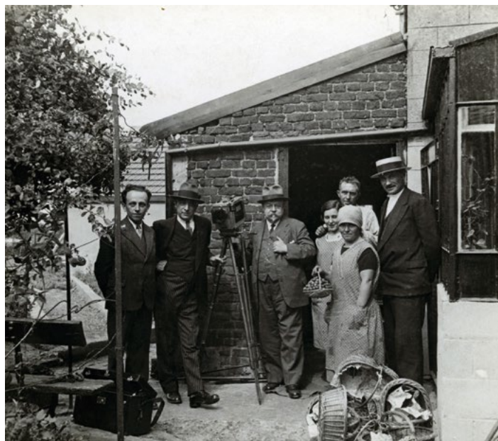
Enquête sur la culture de la fraise à Vottem en 1933