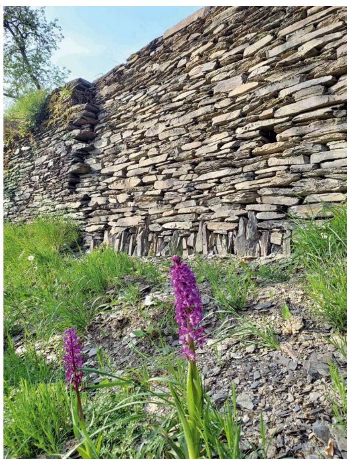
Mur de soutènement de terrasses en schiste restauré sur la colline du Deister à La Roche-en-Ardenne

La méthode de construction en pierre sèche n'utilise pas de liant mais bien des pierres de différents calibres, calées les unes par rapport aux autres, qui en sont le matériau unique. Un bon dimensionnement de l'ouvrage doit être déterminé au départ avec une épaisseur minimale et cohérente avec l'usage du mur. Enfin, il faudra appliquer à chaque pierre quelques « règles » telles que le fruit du mur, le pendage des pierres vers l'intérieur du mur, le croisement des joints dans toutes les dimensions ou encore la jonction entre les modules placés entre l'avant