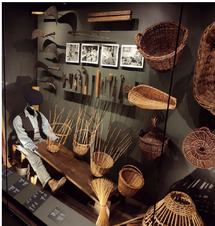
Vitrine illustrant la muséographie inspirée des principes de Rivière au Mueson Arlaten