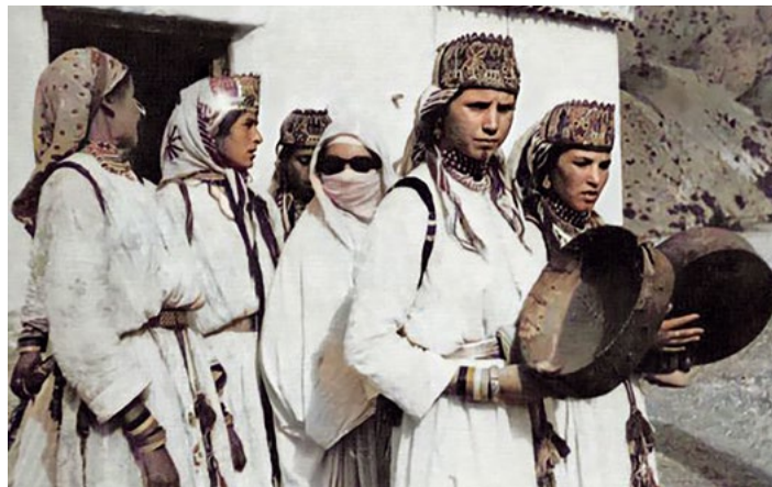
Dames rifaines avec adjoune lors d'un mariage, Aït Turirth, 1962

Mes parents sont nés et ont grandi dans un village rif de la tribu d' Aït Wayegher . Bien qu'ayant acquis un timide français après leur arrivée en Belgique dans les années 1990, ils m'ont toujours parlé en rifain, j'ai donc baigné dans cette ambiance depuis ma tendre enfance. C'est à ma mère, surtout, aujourd'hui décédée, que je dois mon attachement à la culture et à la langue rifaines. Grande oratrice et poétesse, c'est elle qui m'a initiée aux chants, contes et cérémonies rifaines, et c'est à elle que je dédie aujourd'hui cet article.