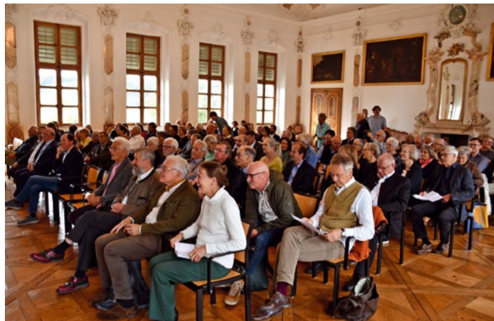
Inauguration de l'IZTB, Sankt-Urban, 2022