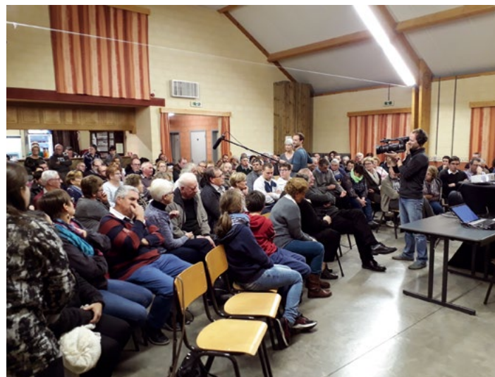
Collecte de témoignages en public lors du projet « On vivait ainsi ? »

Et le public, là-dedans ? En 2019, le musée choisit d'actualiser sa dénomination en Musée de la Grande Ardenne , qu'il définit comme le territoire couvert par la province de Luxembourg, principalement, avec une porosité frontalière envers les régions voisines, à savoir les provinces de Namur et de Liège, le Grand-Duché de Luxembourg et le département des Ardennes. Le musée se présente comme un musée de société dont l'objectif est de questionner les liens que l'homme entretient avec son environnement : patrimoine, histoire, art, religion,