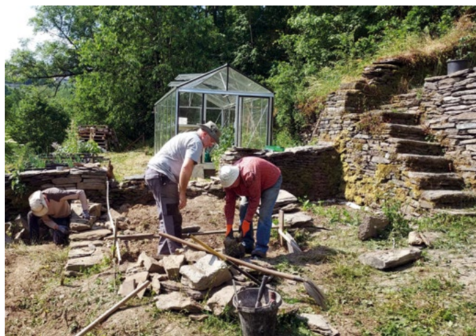
Rampe caladée et mur construit par les bénévoles "Lès Sêches Pîres" dans les jardins potagers de Sertomont au centre de la ville d'Houffalize

Avec ces caractéristiques précieuses, les murs en pierre sèche sont des endroits similaires à des écosystèmes naturels de plus en plus rares tels que les falaises ou les éboulis. Les lichens sont les premiers à s'y implanter, puis viennent les mousses. Leur dégradation permet l'apparition d'un premier substrat favorable à l'installation de sédums, fougères et plantes à fleurs qui fournissent de la nourriture à la faune s'établissant au sein des anfractuosités du mur. Arthropodes (cloportes, araignées, abeilles, grillons...), reptiles (lézards, couleuvres coronelles, orvets), amphibiens (crapauds, grenouilles, tritons, salamandres...), petits oiseaux et mammifères cavernicoles (moineaux, mésanges, troglodytes, chauves-souris...) en sont quelques exemples.