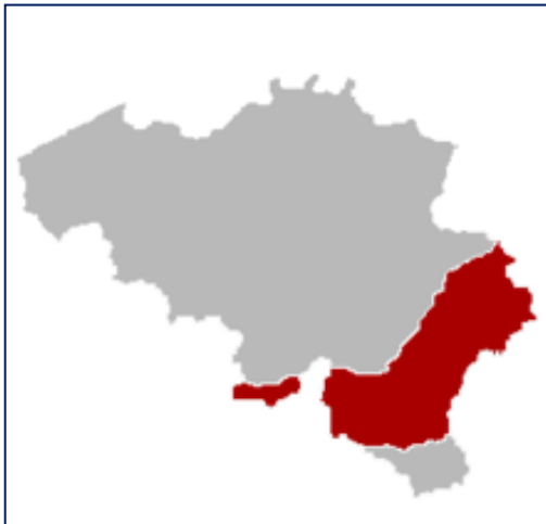
Figure 1 : Carte de la Belgique – Localisation de l'Ardenne

Un canal d'abissage est encore en activité. Il est situé à proximité du village de Cierreux, dans la commune de Gouvy, au nord de la Province du Luxembourg.