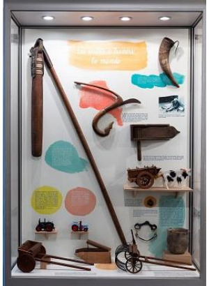
Vitrine B - Monde