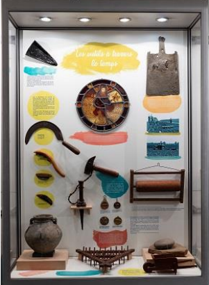
Vitrine A – Temps