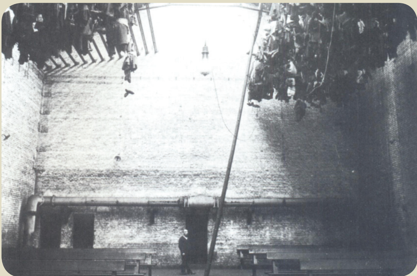
Salle des pendus , photographie, vers 1907, Musée de la Mine et du Développement Durable, Houdeng-Aimeries.