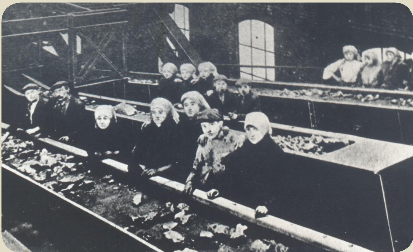
Triage-lavoir aux charbonnages du Bois-du-Luc, photographie, début XX e siècle.