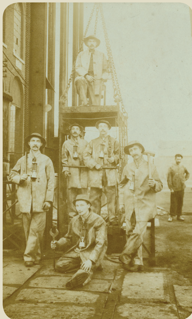
Groupe de mineurs de Jemeppe-sur-Meuse , photographie, vers 1900, Fonds Paul Donnay, collection Blegny-Mine.

« En haut, la température montait jusqu'à trente-cinq degrés, l'air ne circulait pas, l'étouffement à la longue devenait mortel. Il avait dû, pour voir clair, fixer sa lampe à un clou, près de sa tête ; et cette lampe, qui chauffait son crâne, achevait de lui brûler le sang. Mais son supplice s'aggravait surtout de l'humidité. La roche, au-dessus de lui, à quelques centimètres de son visage, ruisselait d'eau, de grosses gouttes continues et rapides, tombant sur une sorte de rythme entêté, toujours à la même place. »