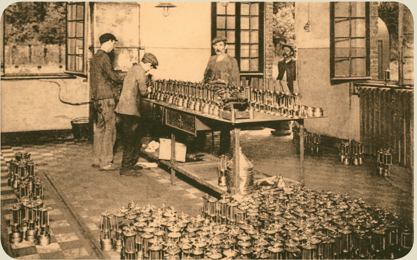
Lampisterie au charbonnage de Mariemont-Bascoup, photographie, vers 1909, collection Blegny-Mine.