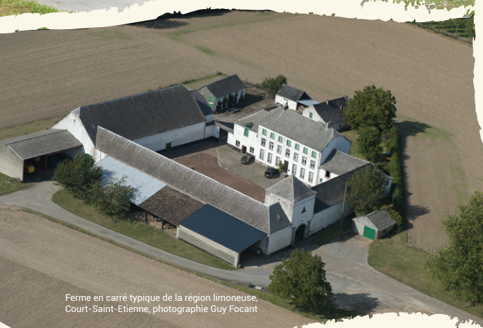
Ferme en carré typique de la région limousine, Court-Saint-Etienne, photographie Guy Focant