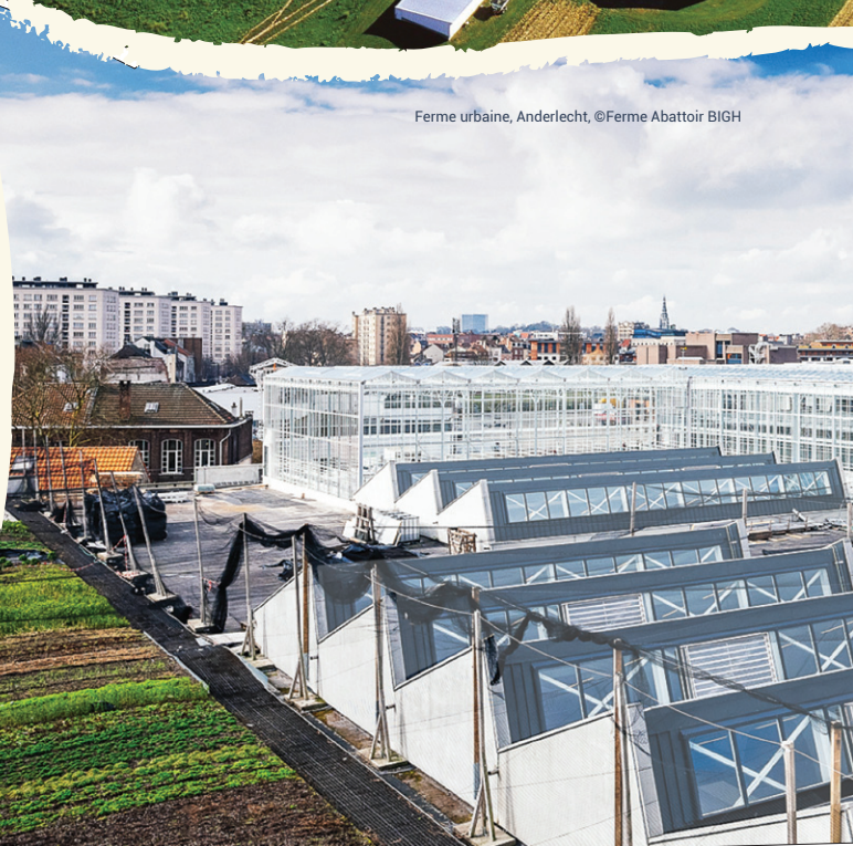
Ferme urbaine, Anderlecht