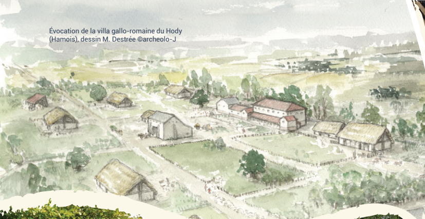
Évocation de la villa gallo-romaine du Hody (Hamois), dessin M. Destrée ©archeolo-J