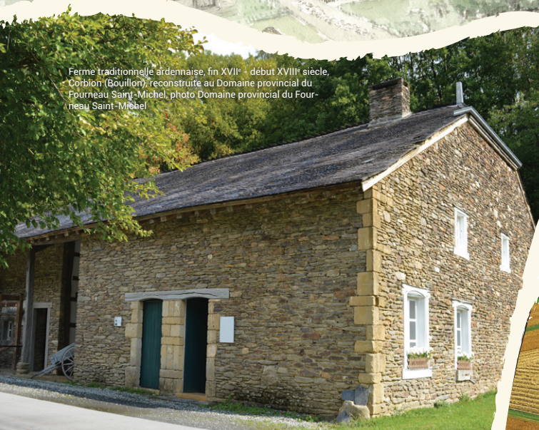
Ferme traditionnelle ardennaise, fin XVII e - début XVIII e siècle, Corbion (Bouillon) reconstruite au Domaine provincial du Fourneau Saint-Michel, photo Domaine provincial du Fourneau Saint-Michel