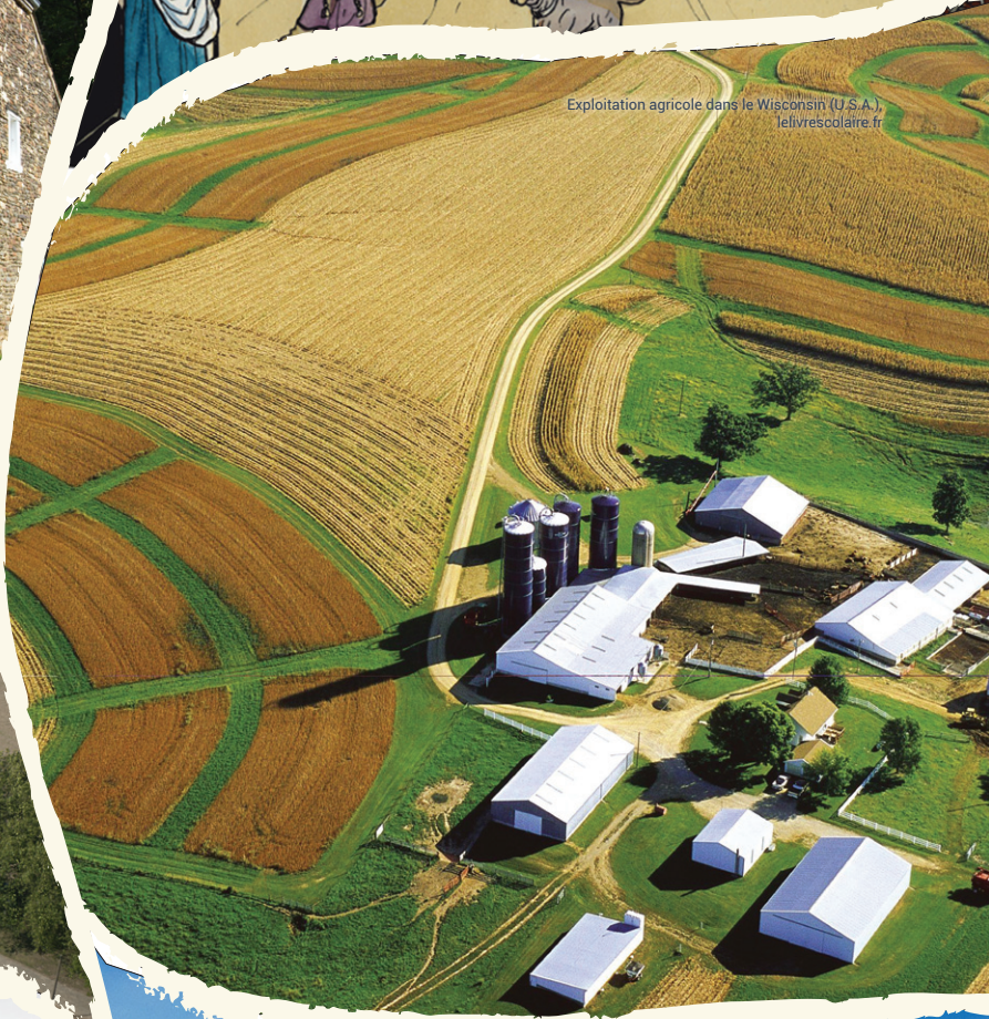
Exploitation agricole dans le Wisconsin (U.S.A.)